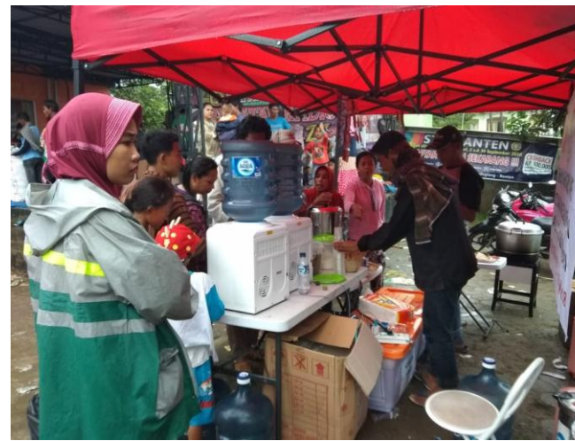
Dapur air di Pengungsian Radio Krakatau, Jl. ahmad yani, Labuan, Pandeglang