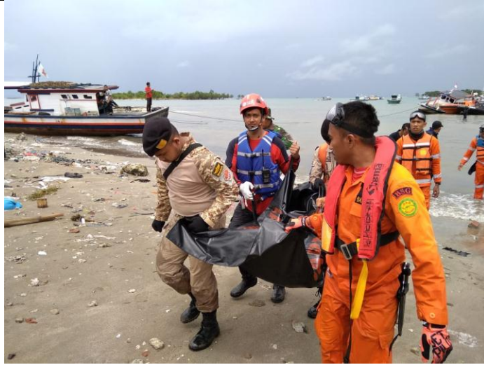
Evakuasi ditemukan di Pulau OE, Desa Sumber Jaya, kec. Sumur