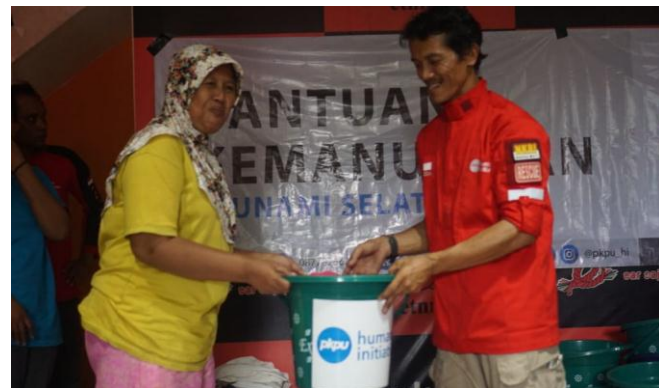
Distribusi Hygiene Kit di Pengungsian Rad Krakatau, Jl. ahmad yani, Labuan, Pandeglang