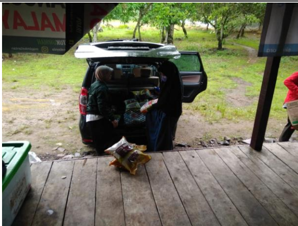
Persiapan Distribusi Logistik di Pos PKPU